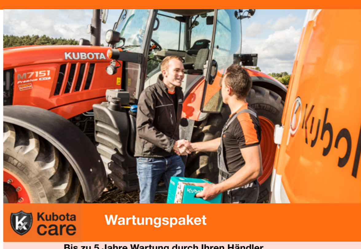
Kubota care Wartungspaket Bis zu 5 Jahre Wartung durch Ihren Händler

Halten Sie Ihre Maschine in Topform mit dem Kubota Protect-Wartungspaket für weniger Sorgen in Ihrem Alltag. Durch unseren 5-jährigen Wartungsplan profitieren Sie von voller Kostentransparenz. Außerdem verpasst Ihre Maschine kein wichtiges Wartungsintervall.